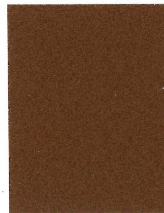
Saddle Brown SU-0998 Marrón de sillín SU-0998