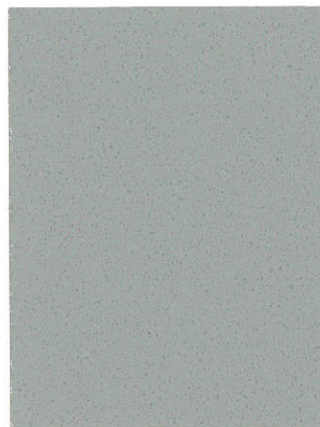
Light Gray SU-0310 Gris claro SU-0310