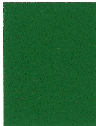
Pine Green SU-0789 Verde de pinos SU-0789