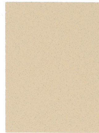
Desert Sand SU-0922 Arena del desierto SU-0922