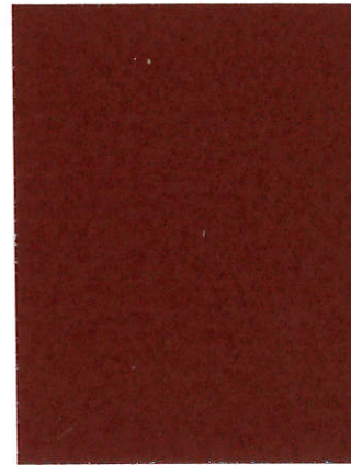
Tile Red SU-0505 Rojo de azulejos SU-0505