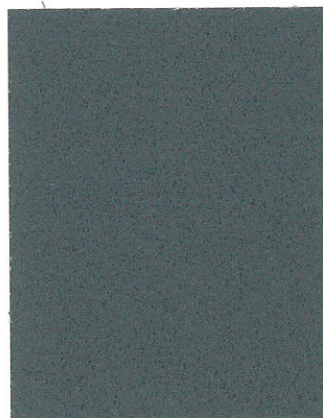
Gray Pearl SU-0308 Gris perlado SU-0308